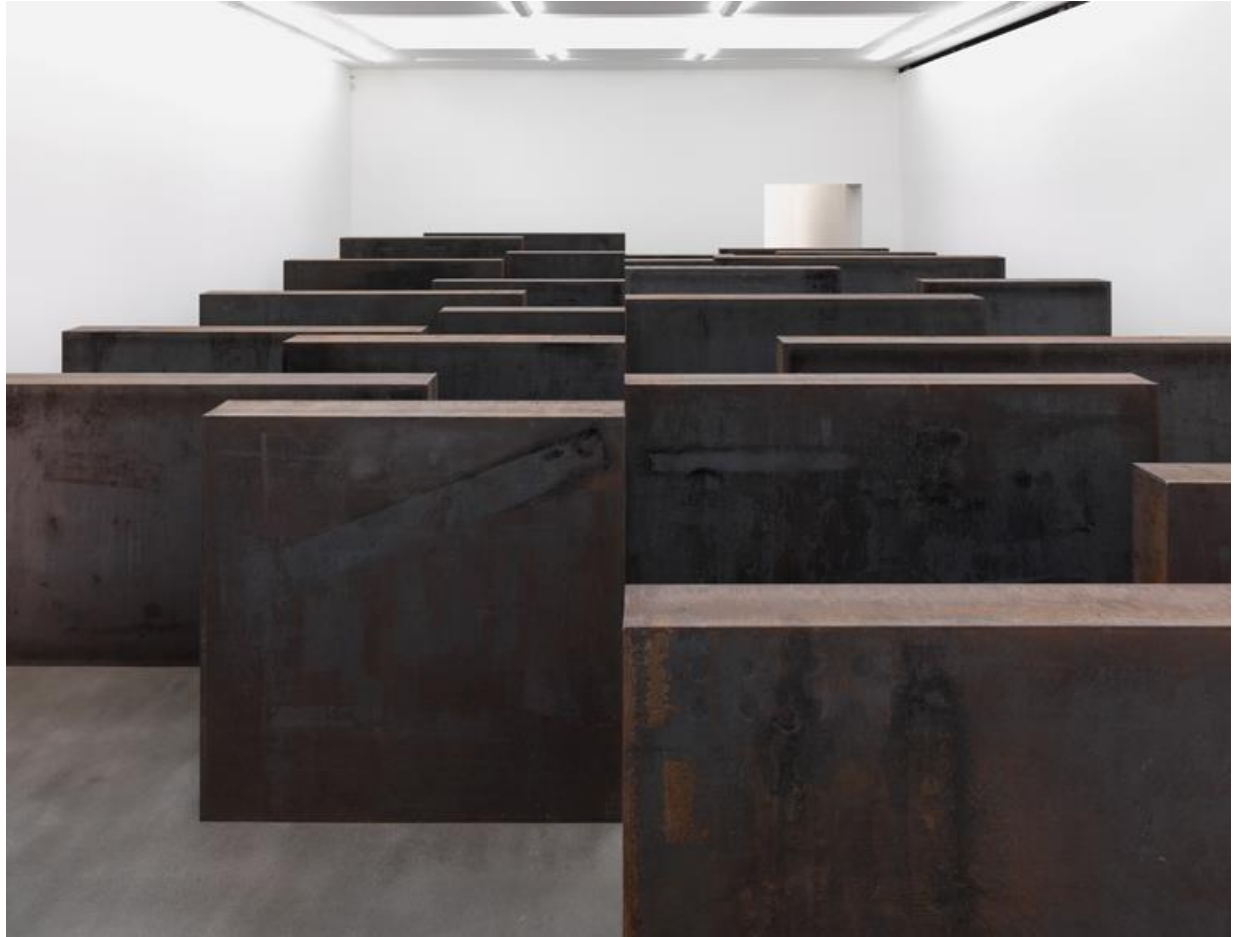
Richard Serra Ramble, 2015 Gagosian Gallery, London

Οι κύβοι που μπορούν να θεωρηθούν και άδεια βάρη σχεδιάζουν μια εικόνα σαν να φτιάχτηκε από πίξελ στον θεατή.