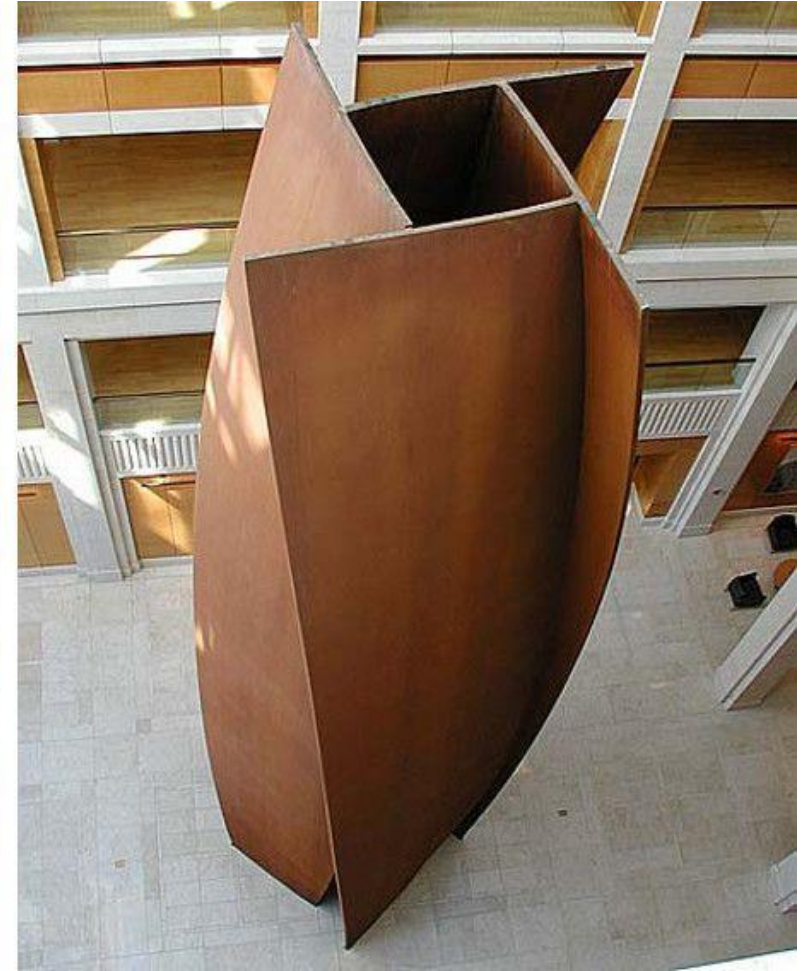
Richard Serra Charlie Brown, 2000 Corten steel, 60' tall San Francisco