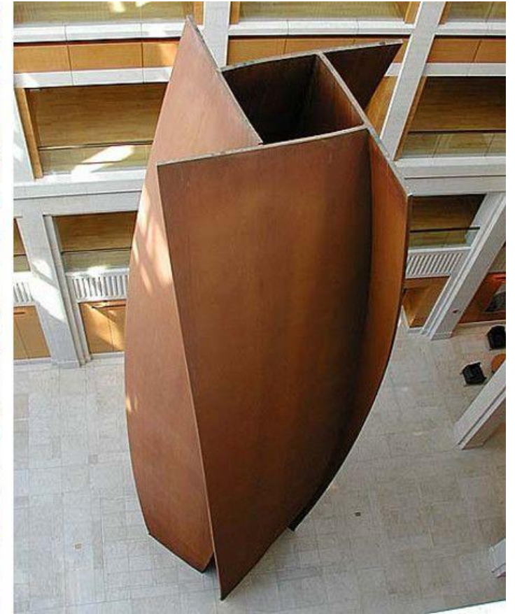
Richard Serra Charlie Brown , 2000 Corten steel, 60' tall San Francisco